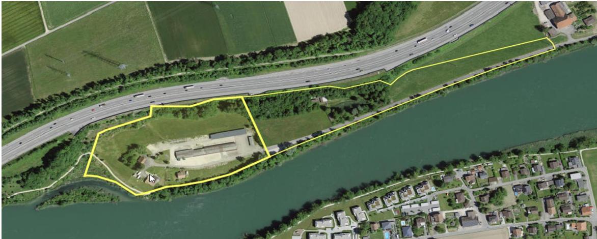
Parzellen Wangen-GB-Nr. 50 (links) und Wiedlisbach-GB-Nr. 1041 (rechts)

Das Gebiet des BKW Werkhofes ist in der Grundordnung der Landwirtschaftszone zugeordnet. Alle bestehenden Gebäude sind ordnungsgemäss baubewilligt.