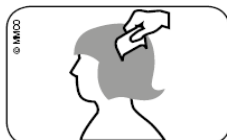
Slika. Češljanje mokre kose češljem za uši od tjemena do vrhova